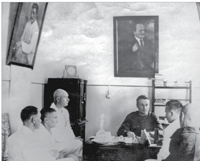
În timpul cercetărilor. Anii 1947–1948